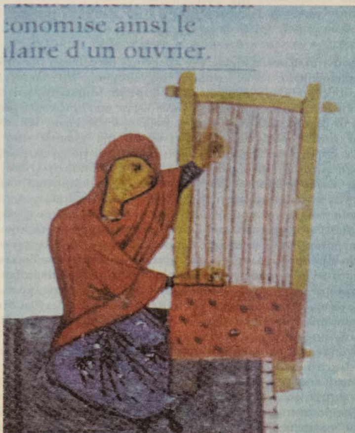
ΕΙΚ. 3 Όρθιος αργαλειός όπου φαίνεται "εομπλιαστί" ύφασμα.

Τα ερωτηματικά που γεννώνται ωστόσο είναι πολλά. Οι γραπτές πηγές δεν παρέχουν επαρκή στοιχεία, όπως ήδη προαναφέρθηκε. Οι εικονογραφικές πηγές από την άλλη