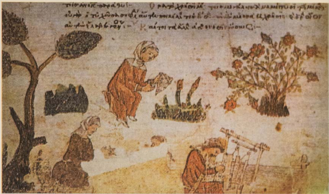
ΕΙΚ. 4 Οριζόντιος αργαλειός Horizontal loom [βλ. υποσημ. 14].