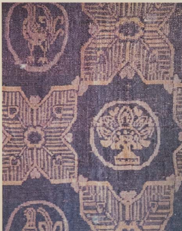
ΕΙΚ. 1 Βυζαντινό ύφασμα με μεγάλα επαναλαμβανόμενα διακοσμητικά μοτίβα. Byzantine figured cloth with large decorative pattern. [ανά Martiniani-Reber, ό.π., σσ. 28,58,59]

Τα είδη ύφανσης που έχουν χρησιμοποιηθεί για την παραγωγή τους είναι περιορισμένα. Πρόκειται για υφάσματα τετράμιτα (weft-faced compound tabby taqueté), εξάμιτα (weft-faced compound twill samit), δαμασκινά (damask, damassé) και διάσπρα (lampas, diasper) 2 , στην πλειοψηφία τους μεταξωτά. Τα μάλλινα, ωστόσο, δεν απουσιάζουν εντελώς και αρκετά δείγματα της παλαιοχριστιανικής περιόδου έχουν