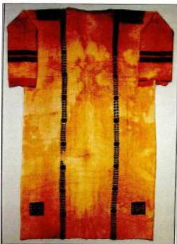
2. Κατακόρυφός (5ος αι.), διακοσμημένος με την τεχνική της ταπισερί είναι το τυπικό ένδυμα όλων των κοινωνικών τάξεων κατά την πρώιμη βυζαντινή περίοδο.

Τα υφάσματα αυτά κατασκευάστηκαν –στην πλειονότητά τους τουλάχιστον– σε άρθρα αργαλείου με δυο σταθερές οριζόντιες ραβδούς-ρολά 2 (εκ. 4) για το τέντωμα του στήμιου, στον οποίο η ύφανση γίνεται από κάτω προς τα πάνω, το υφάδι συμπιέζεται προς το έδαφος και το έτοιμο ύφασμα διπλώνεται στην κάτω ραβδό. Το εργαλείο αυτό επιτρέπει στην υφάντρα να κόβεται όταν δουλεύει, όπως μαρτυρούν και οι σχετικές απεικονίσεις σε μικρογραφίες βυζαντινών χειρογράφων του 11ου και του 13ου αιώνα 3 (και πάλι η βυζαντινή τέχνη εμφανίζεται να υιοθετεί με καθυστέρηση κατά πολύ προγενέστερες τεχνολογικές κατακτήσεις, ωθώντας μας να τη χρησιμοποιούμε με μεγάλη επιφύλαξη ως πηγή της σύγχρονης της πραγματικότητας). Σημειώνεται, ωστόσο, ότι στις μικρογραφίες αυτές τα υπό κατασκευή υφάσματα καλύπτονται με διακοσμητικά σχέδια σε ολόκληρη την έκτασή τους και παραμένουν στον τύπο διακόσμησης που επικρατεί κατά τη μέση και ύστερη βυζαντινή περίοδο, εποχή κατά την οποία φυλάεχτηθήκαν τα ίδια τα χειρογράφα 4 κατά συνέπεια, γεννώνται ερωτηματικά σχετικά με το βαθμό ρεαλισμού των απεικονίσεων. Ο τύπος αυτός του άρθρου αργαλείου