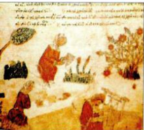
6. Οριζόντιος αργαλείος με μπάρα και πατήματα τύπος αργαλείου που επικράτησε μέχρι της νεότερης χρόνων.

Το μέγεθος του αργαλείου αυτού του είδους, ο οποίος καταλαμβάνει μεγάλο χώρο, και η πολύπλοκότητα της λειτουργίας του, που προϋποθέτει μεγάλο χρόνο κατά την αρχική διευθέτηση των νημάτων που καθορίζει κάθε φορά τη μορφή των παραγόμενων υφασμάτων και τη διαρκή συνεργασία περισσότερων προσώπων κατά την ύφανση, καταδεικνύουν ότι δεν ήταν δυνατό να ενταχθεί στα πλαίσια της οικογενείας. Η προμήθεια και η χρήση τέτοιων αργαλείων και, συνακόλουθα, η κατασκευή των περιπέτρων, από πολύτιμα συνήθως υλικά εξομολιστών υφασμάτων που παράγον, επέβλεπουν την οργάνωση μεγαλύτερων μονάδων παραγωγής. Από στοιχείο συνιστά ομάδα πορφύρων, εξάματων, μεταξωτών υφασμάτων που φέρουν, υφασμένα, τα ονόματα των αυτοκρατόρων του 10ου και 11ου αιώνα ή –σε μία περίπτωση (εικ. 8 α, β)– το όνομα του άρχοντα του βασιλικού εργοδότη στο οποίο είχε υφανθεί: ++Επί Μιχ(ηλ) πριμ(ηρίου) επί του) κοι(τωνος) (και) ειδικου / +Πέτρον αρχον(τος) του Ζευ(ηρη)νου νδι(κτιώνος) [...]. Πρόκειται για υφάσματα που είχαν υφανθεί στο κρατικό αυτοκρατορικό εργαστήριο, ενώ την ίδια περίοδο, σύμφωνα με το Επαρχικό Βιβλίο, υπήρχαν στην Κωνσταντινούπολη συνεχώς ιδιωτών, που