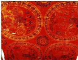
8α. Εξόμο πορφυρό μεταξίνο (περίπου 1000 μ.Χ.) των αυτοκρατορικών εργαστηρίων, κοσμημένο με ελέφαντες. β. Λεπτομέρεια του μεταξίνου με την ενυφαντική επηρεασή.

Το νέο και δυναμικό στοιχείο του βυζαντινού βεστιαρίου, που μοιράζονται όλες οι κοινωνικές ομάδες, αποτελούν από την αρχή της βυζαντι-