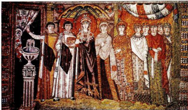
3. Η αυτοκράτειρα Θεοδώρα και η ακολουθία της φορούν ενδυμασία, των οποίων το υφάσμα είτε φέρουν διάκοσμο σε περιορισμένες ζώνες (πιθόνες, επιπλάστρον με την τεχνική της τσιπσερί) είτε κοσμοεισάγει σε όλη τους την έκταση (ζομπλιαστά υφάσματα).