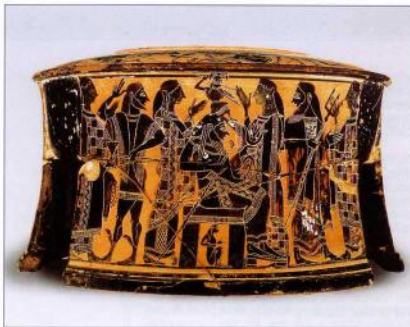
2. Η γέννηση της Αθηνάς. Πίσω από τον Δία ο Ήρακλος, κρατώντας τον Πάριον με τον οποίο άνοιξε το κεφάλι του πατέρα των θεών. Αττικό μελανόχρωμο τριπλοκόμο εξόλεκτρο, 570-565 π.Χ. Παρίσι, Μουσείο του Λούβρου.

Κοντολογία, ολόκληρη η Τεχνολογία εκφράζεται και συγκεντρώνεται στο όνομα Δαίδαλος , τα προσωπικά έργα του οποίου κατά τον μύθο καλύπτουν πράγματι μίαν ευρύτατη ποικιλία τεχνημάτων. Ήταν δε ένας μύθος έμμονος, προγενέστερος ίσως των ομηρικών επών – μέχρι και τους ρωμαϊκούς χρόνους.